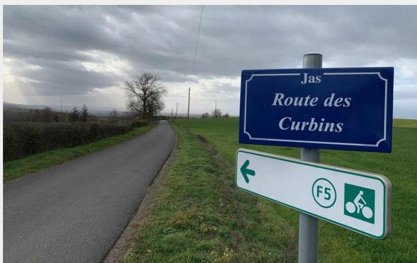
Panneau F5 (OT FOREZ-EST)