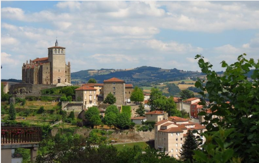
Vue générale (OTIMDL)