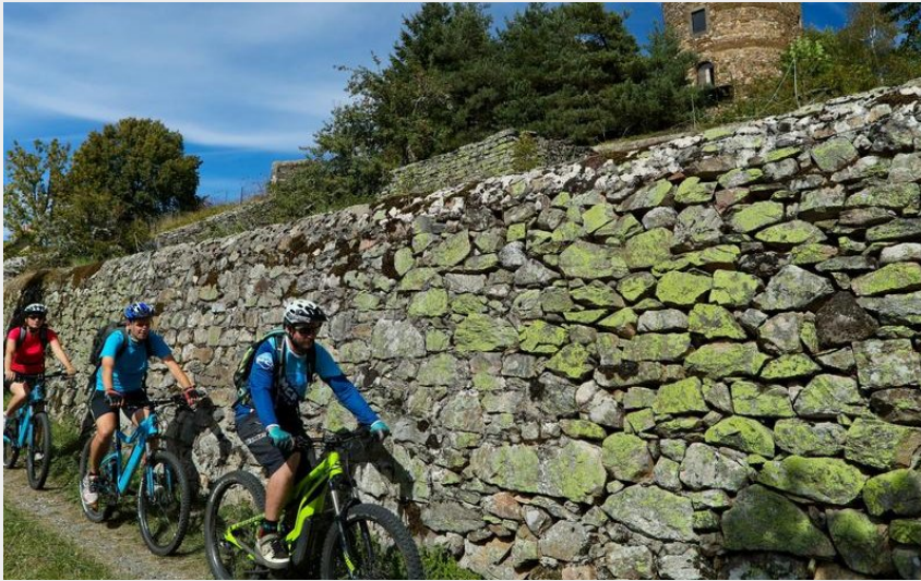
Ruynes e margeride en VTT (Hervé Vidal)