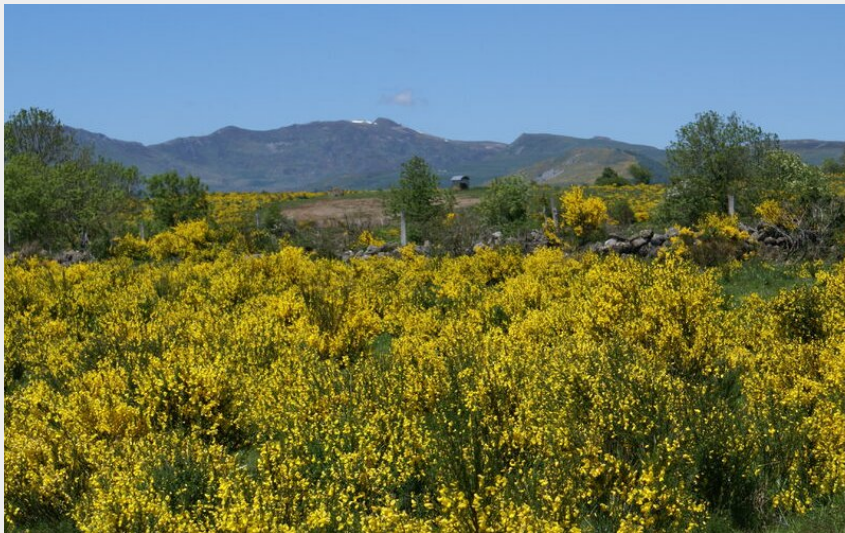
Vue du Bois de Montrozier vers le Massif du Cantal (Bureau de Tourisme de Pierrefort)