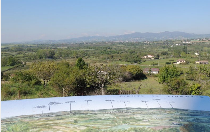
Table d'orientation Vieux Bourg de Montagny