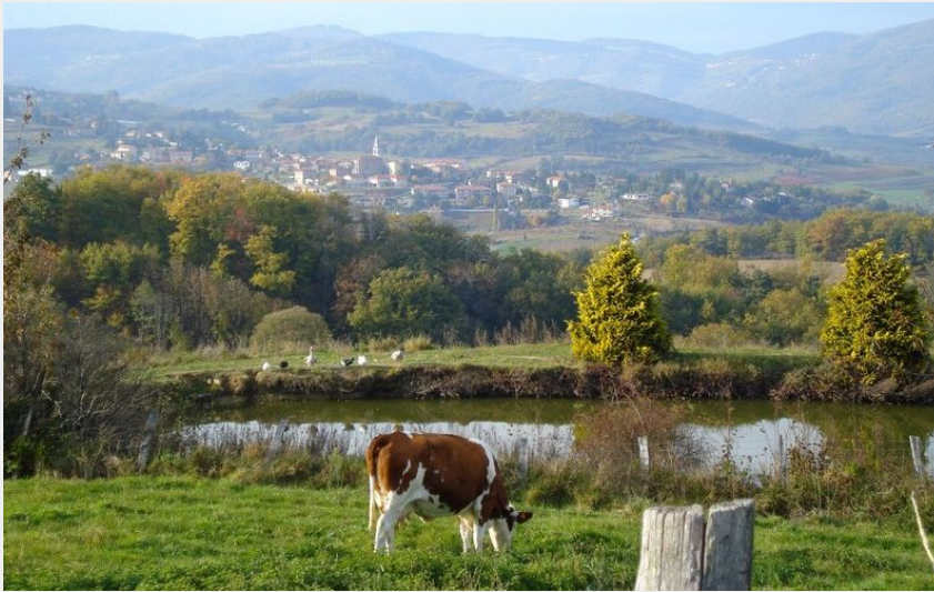
Vue sur Rontalon (COPAMO)