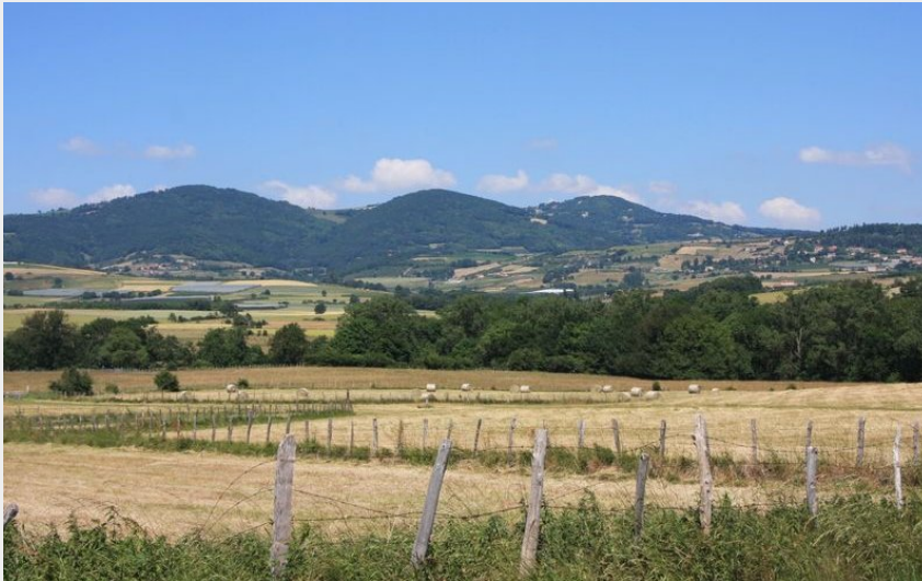
Vue Monts du Lyonnais (COPAMO)