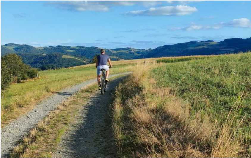
circuit La Voie romaine (OTIMDL)