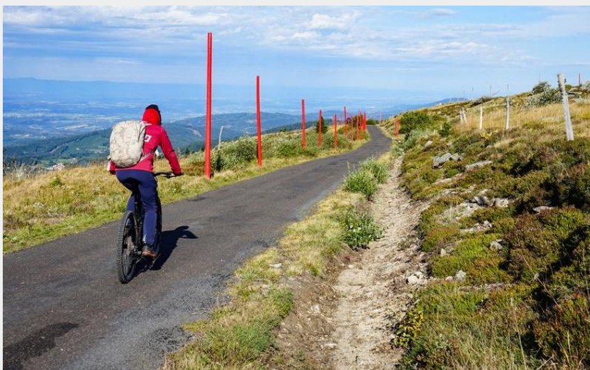
Le col des Supeyres (OTLF)