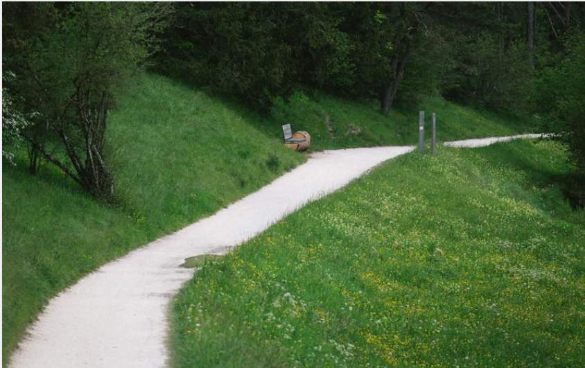
Le chemin des traces - bleu (Pierre Perrodin)