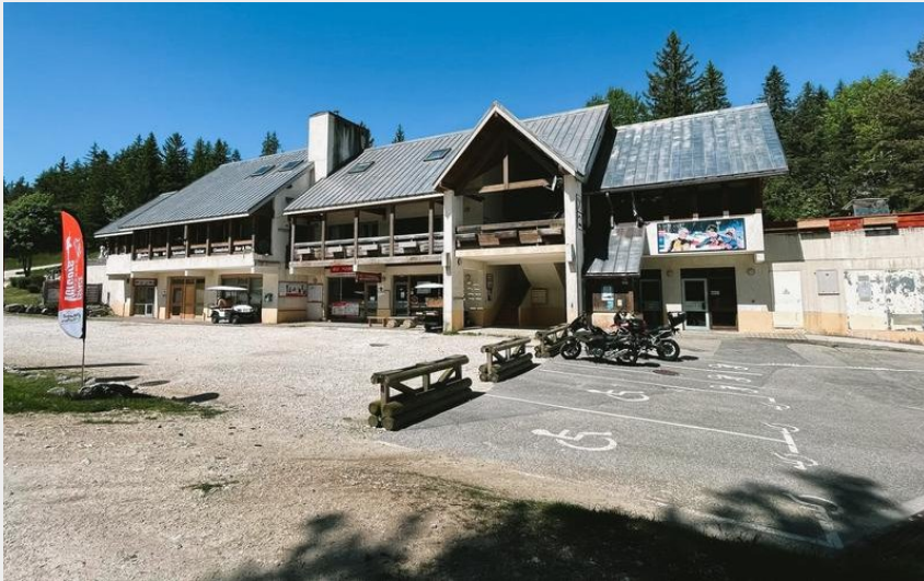
240617-49LaRoyale-rouge-1