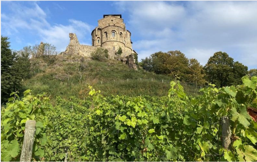
Vignes et prieuré