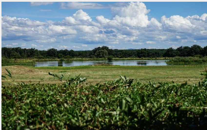
Réserve de Biterne (Office de tourisme Loire Forez)