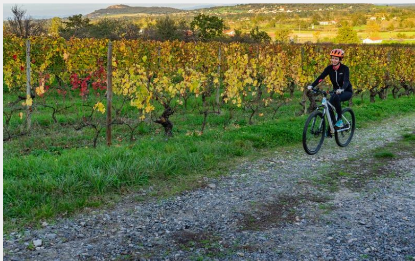
Vélo à Champdiéu