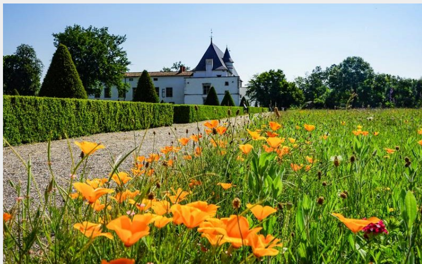
Château Bâtie d'Urfé (Office de tourisme Loire Forez)