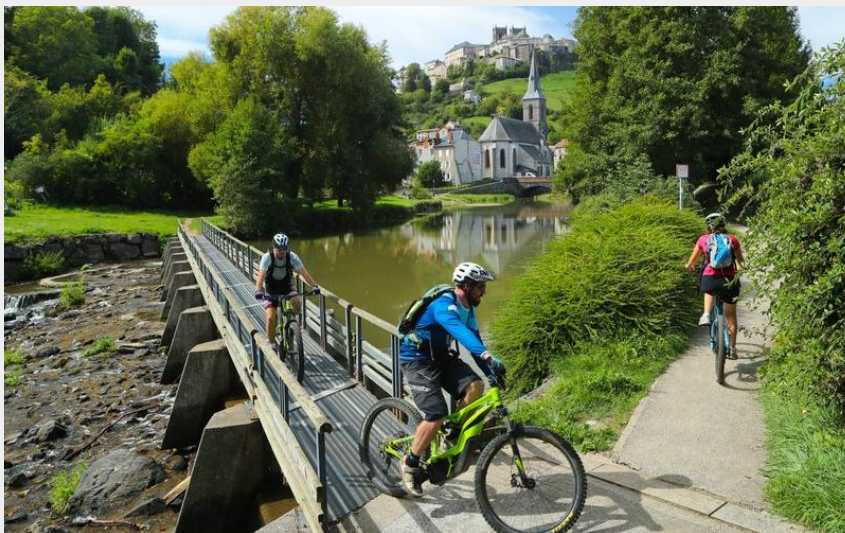
Grand tour VTT à Saint Flour (Hervé Vidal)