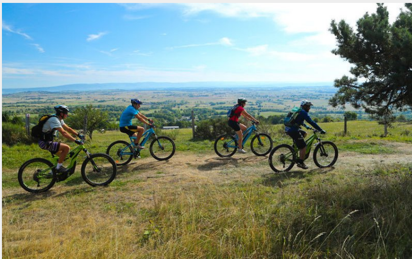
Grand Tour VTT Saint-Flour (H.Vidal)