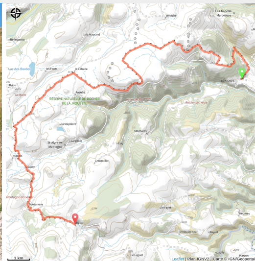
VTT itinérant Cézallier (Vincent Tiphine Videos)