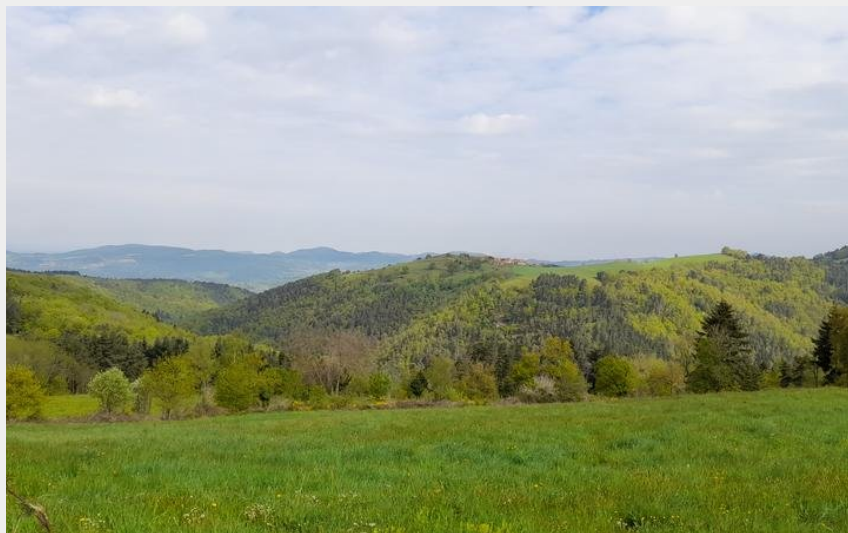
Circuit itinérant (@ybastin)