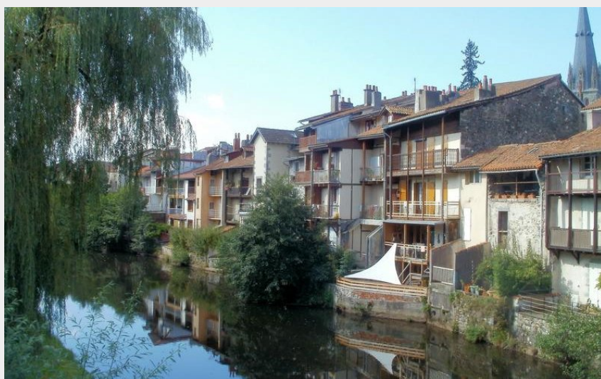
Aurillac - Bords de Jordanne (CD15-ST)