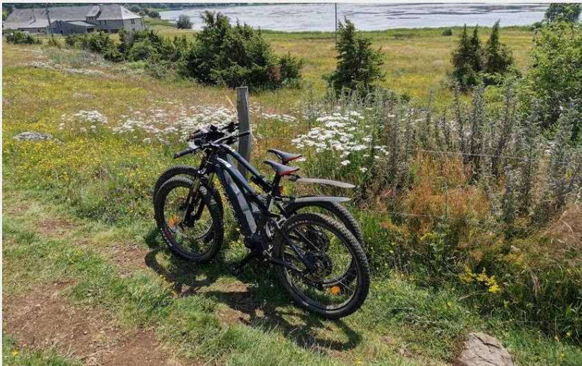
Aux abords du lac du Pêcheur (CD15-ST)