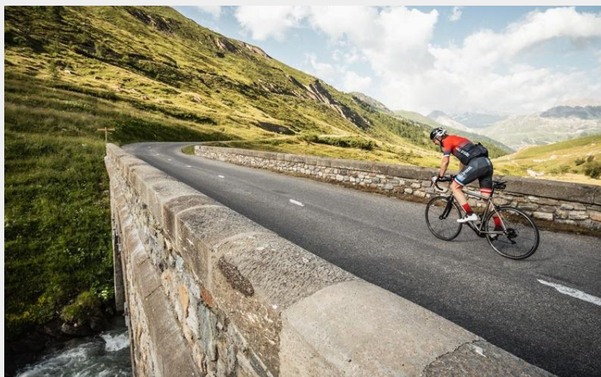
Le pont Saint-Charles (Haute Tarentaise Vanoise - Yann Allègre)