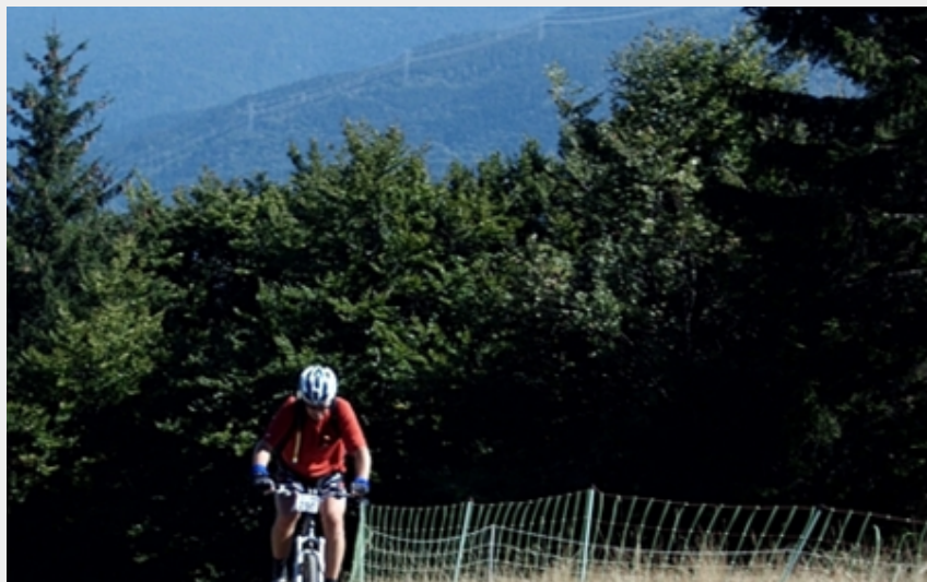
Le Conest (CCM Sebastien Rayot)