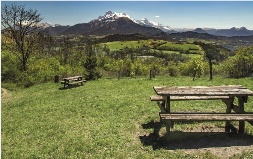
Le paradis