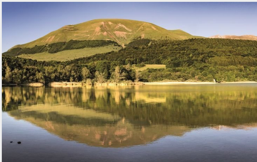
lac de petichet (matheysine tourisme)