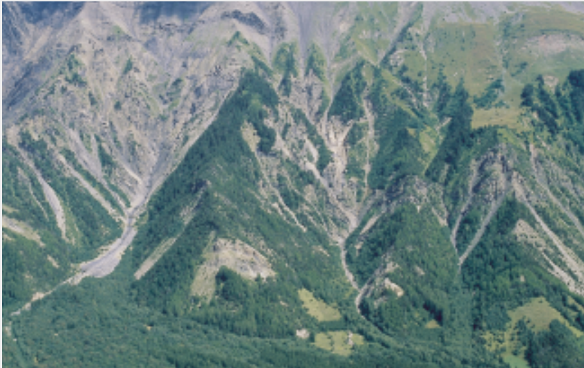
Vue du Col d'Ornon et sa vallée (JP Nicollet)