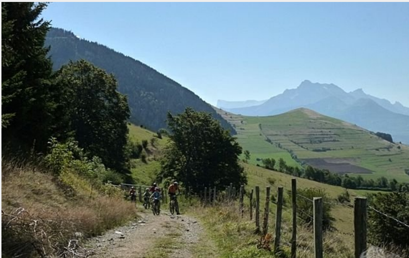
balcon de l'aigle (CCM Sébastien Rayot)