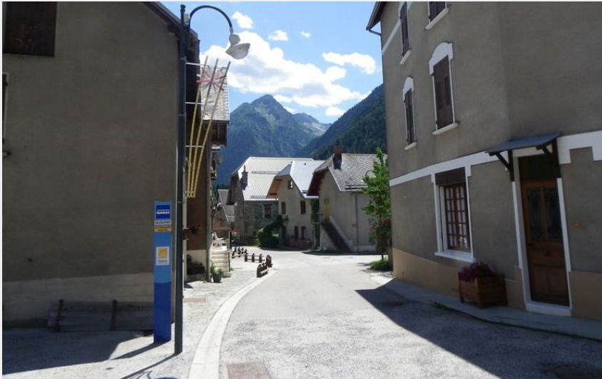
valjouffrey (Matheysine tourisme)