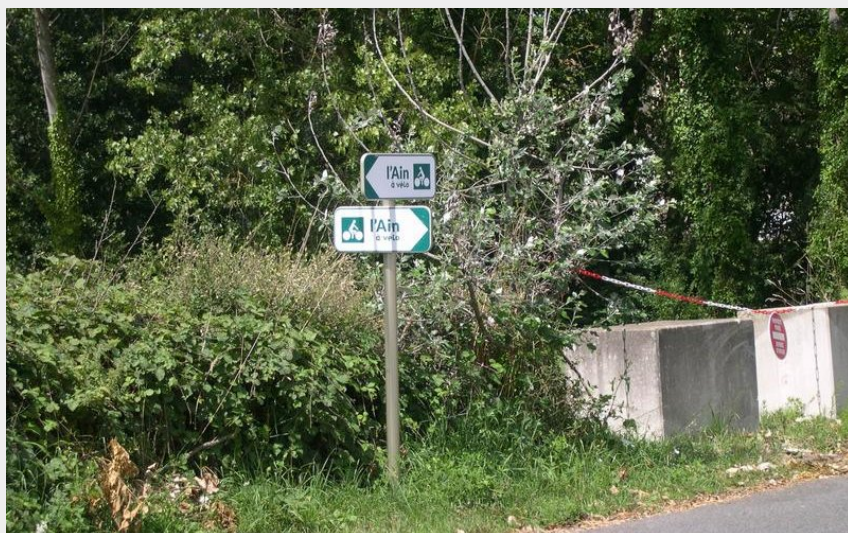
Panneau directionnel L'Ain à Vélo