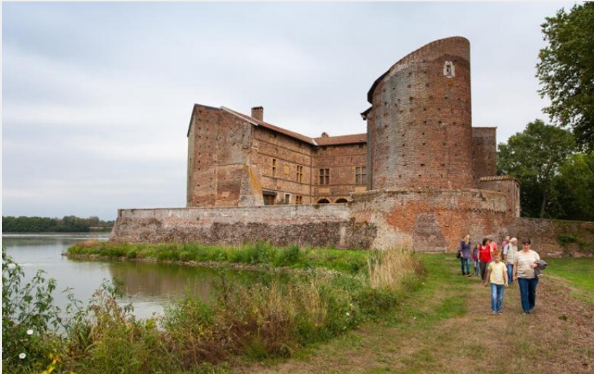
La Tour