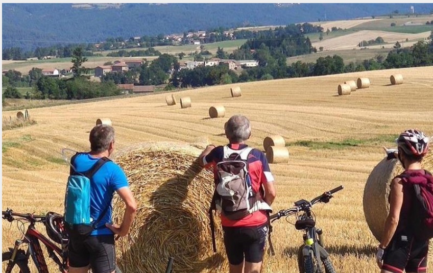
Horizon à perte de vue (OT Loire Semène)