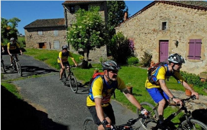
Dans le village en VTT (Auzon communauté)