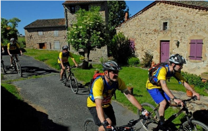
Dans le village en VTT (Auzon communauté)