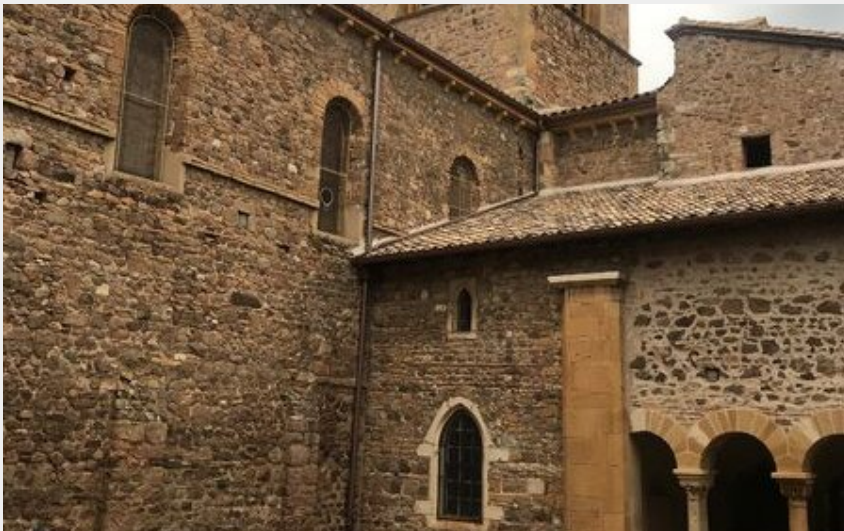
Église Saint-Martin de Salles-Arbussonas-en-Beaujolais (Mihriban DONER)