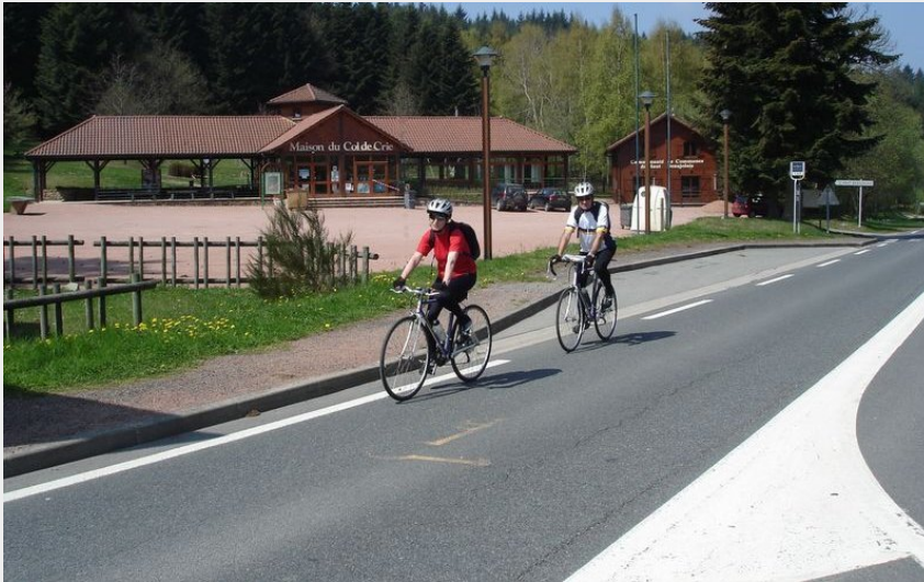
Le toit du Rhône (OT Destination Beaujolais)