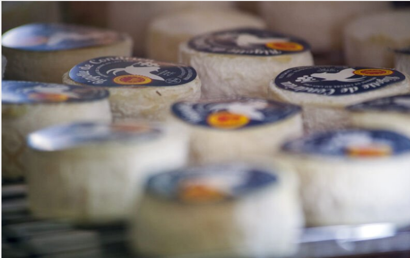
Rigotte de Condrieu (Département du Rhône)