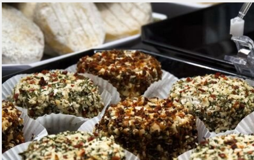
Rigotte de Condrieu (Charlotte Pinay)