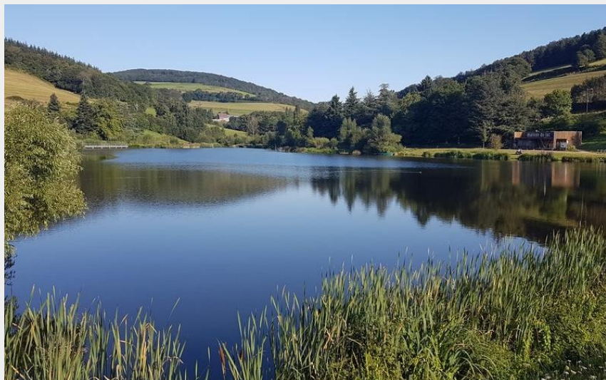
Lac du Ronzey - Yzeron (OTIML)