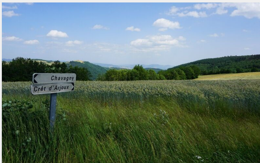
Sur la route vers le Mont Arjoux (Prairy)