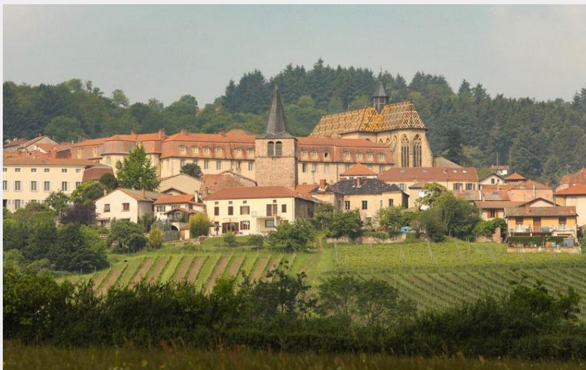
Ambierle : Village de caractère