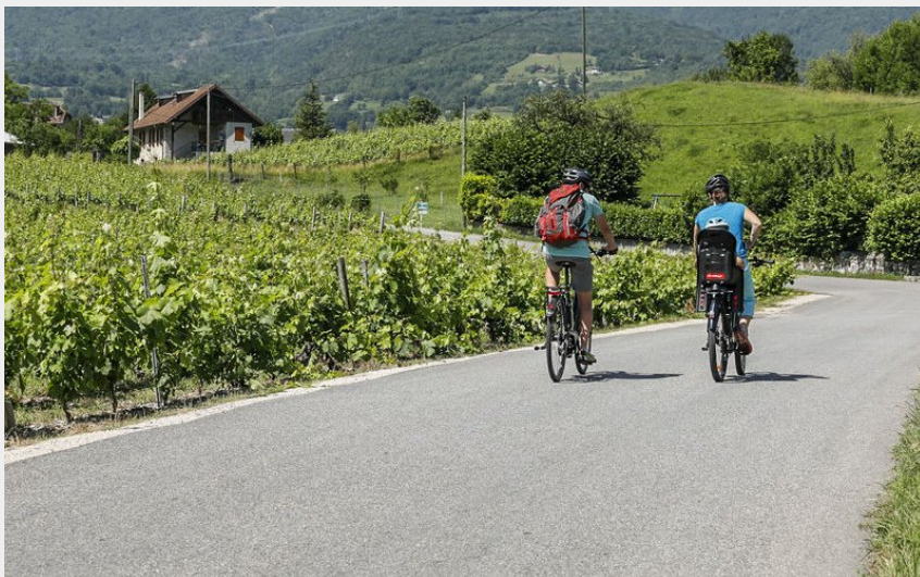
Dans les vignes de Myans (Didier Gourdin - CMCB)