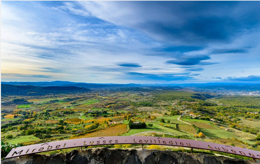
Table d'orientation