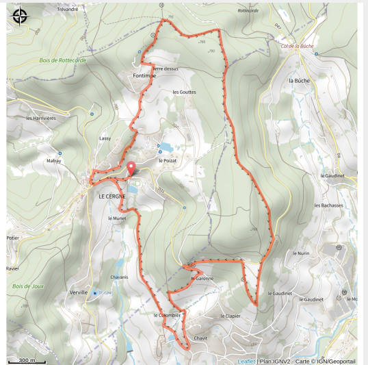
(Charlieu Belmont Communauté)