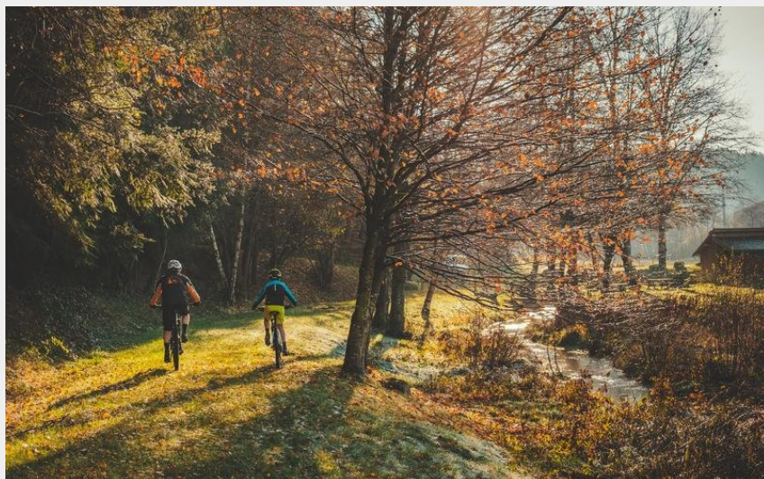
Balade en VTT à Villerest