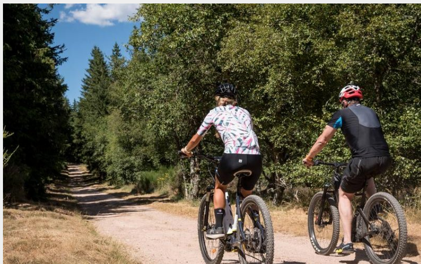
Balade en VTT à Renaison