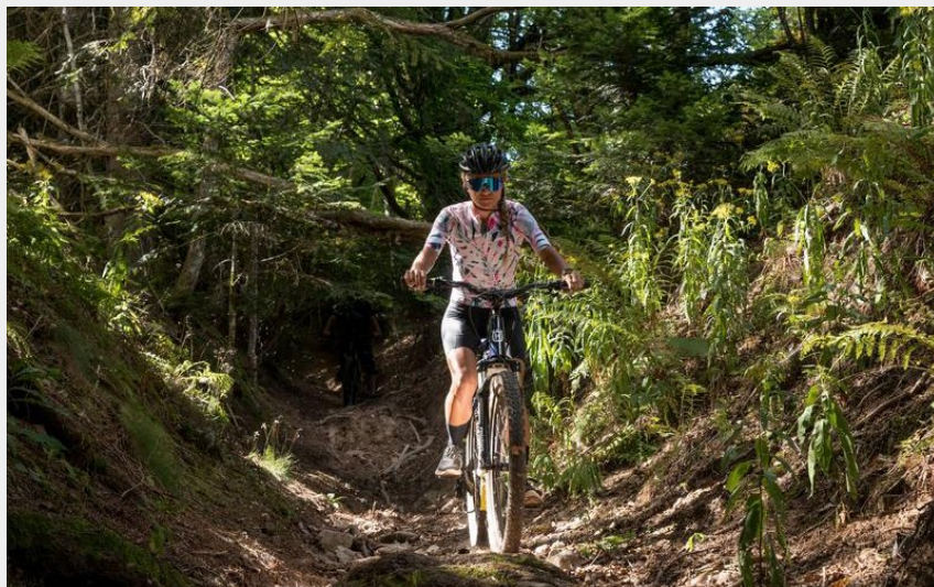
Balade en VTT au Crozet