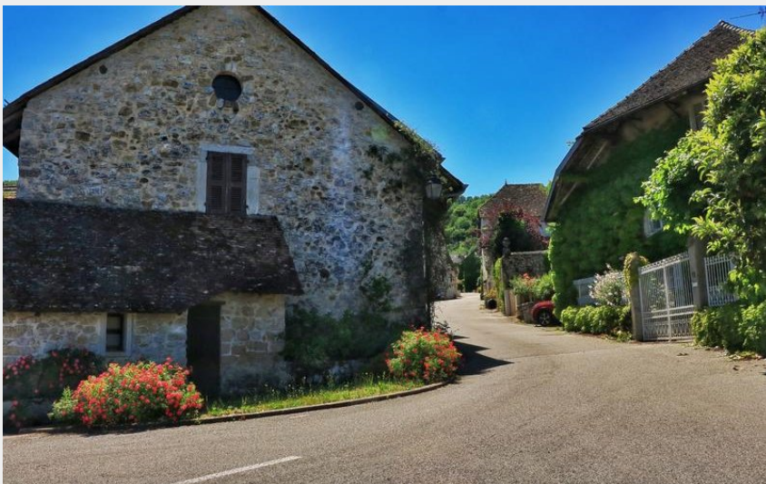
Village de Vongnes