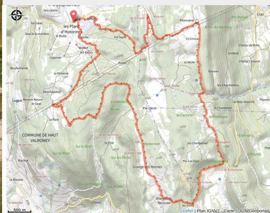
Circuit VTT 13 les Plans d'Hotonnes Plateau de Retord - Bugey Sud