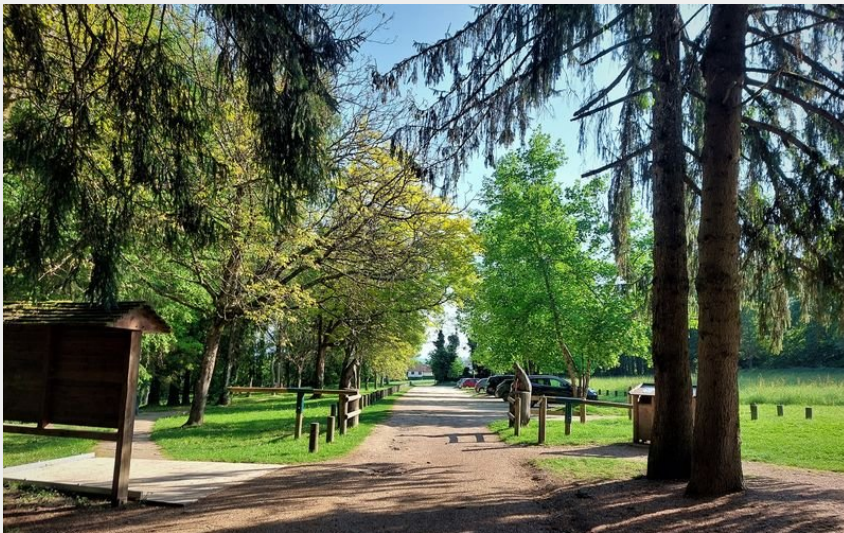
Forêt de Rothonne à Belley (Maxime Ballet)