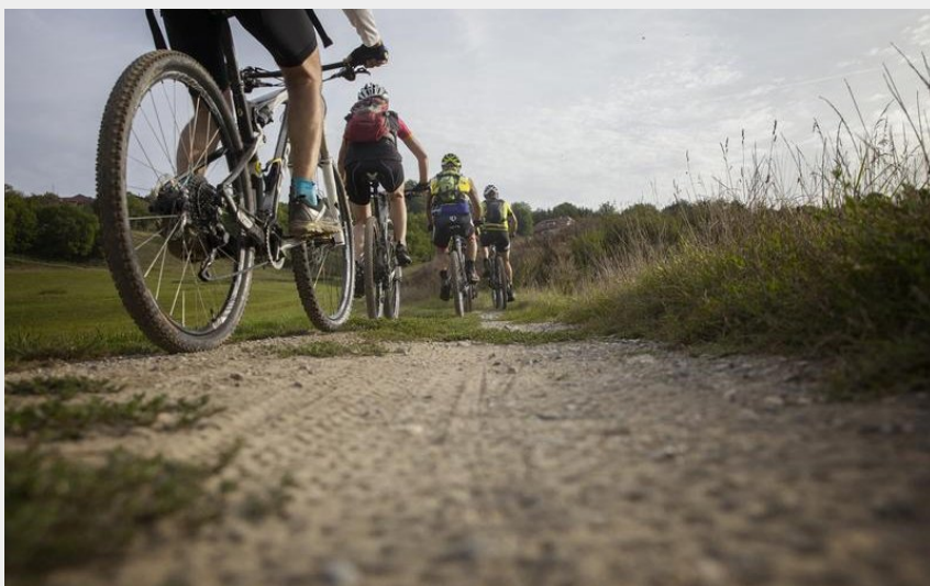
VTT Sur-Lyand