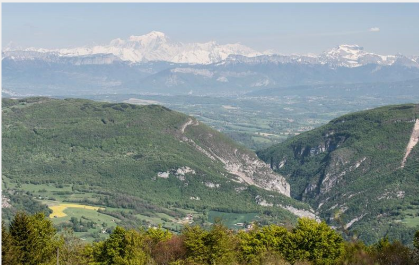
Vue Mont Blanc